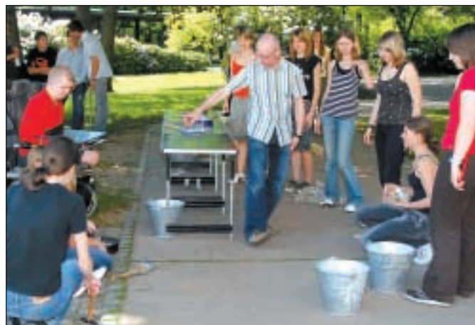
Probe auf dem Schloßberg.