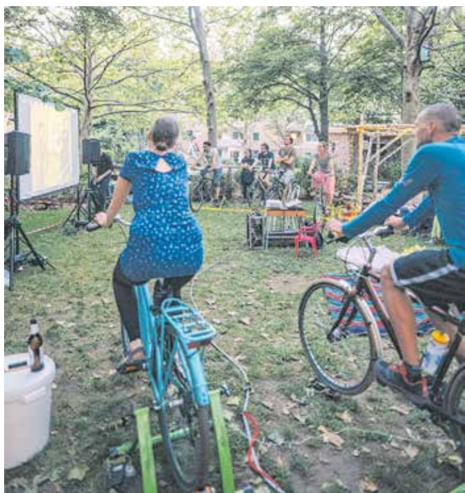
Die Idee des Mikroprojekts »Fahrradkino«: Filme an Orten in Chemnitz zu zeigen, die sonst nicht im Fokus stehen. Und der Strom dafür soll nicht aus der Steckdose kommen, sondern gemeinsam durch Muskelkraft erzeugt werden.