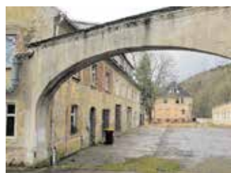
Blick auf den Apellplatz des ehemaligen KZ Sachsenburg in Frankenberg.

Die Tour ist die erste Veranstaltung aus der Projektreihe »ReflAction4« und wird organisiert vom AJZ e. V. und der Geschichtswerkstatt Sachsen e. V. sowie gefördert durch den Lokalen Aktionsplan der Stadt Chemnitz. ■