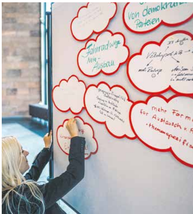
»Das Festival der Meinungsverschiedenheiten« fand 2019 erstmals und als Mikroprojekt statt und war ein Versuch, die Mauern innerhalb der Stadt durch Zuhören und Verstehen zu überwinden.