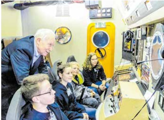
Sigmund Jähn 2019 beim Fachsimpeln mit den Mitgliedern der AG Stammpersonal in der Raumkapsel.