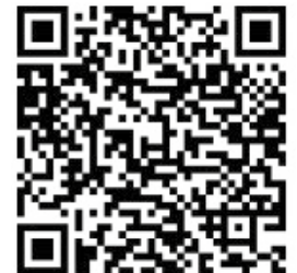
Gesellschaftliche und soziale Vereine

Gern können Vereine bereits im Vorfeld wichtige Themen per E-Mail an buergerbuero@stadt-chemnitz.de senden. Vereine können sich zu den Dialogen unter 0371 488 1502 oder über die nebenstehenden QR-Codes anmelden. ■