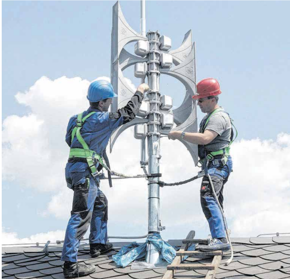
Arbeiter bringen Sirenen auf Chemnitzer Dächern an, die auch bei Hochwasser zur Warnung der Bevölkerung eingesetzt werden.

Die Stadt Chemnitz nutzt die Notfall-Informations- und Nachrichten-App des Bundes – kurz NINA. Damit können Nutzer:innen wichtige Warnmeldungen des Bevölkerungsschutz-