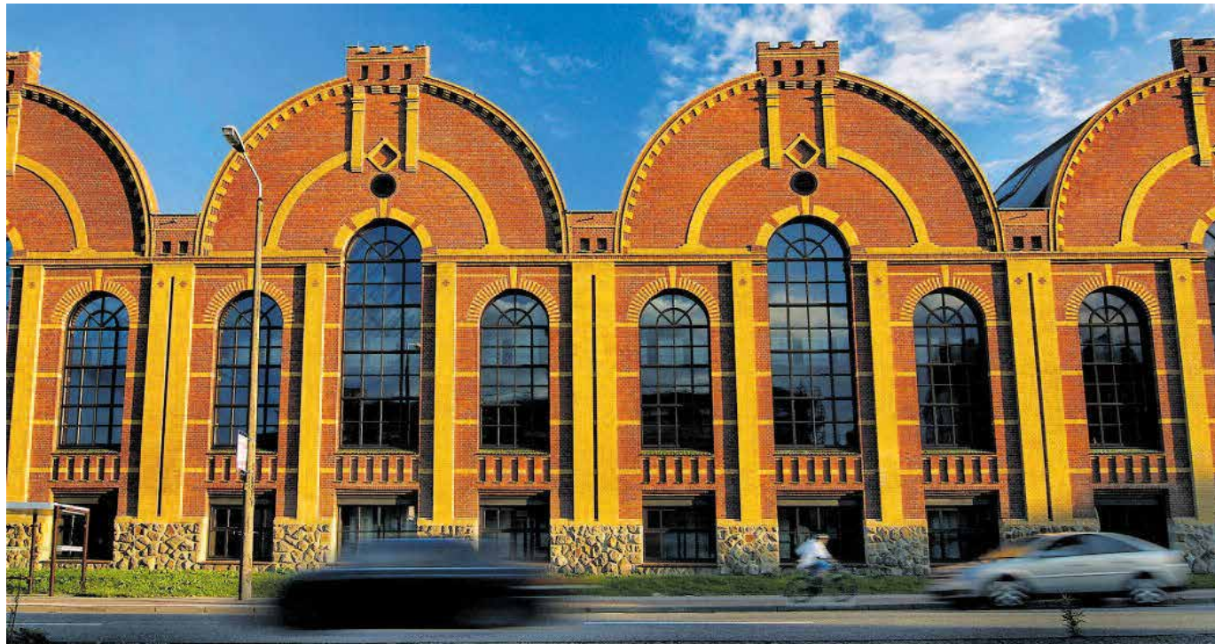
Neben dem Industriemuseum öffnen auch viele weitere Einrichtungen in der Stadt für Kinder und Jugendliche in den Sommerferien ihre Türen: unter anderem die Stadtbibliothek, das smac, die Parkeisenbahn und das Spielemuseum.

»Bienen« (Piotr Socha) – Buchvorstellung 21. August, 11 Uhr Die Plätze sind begrenzt; kostenfreie Anmeldung unter 0371 488-4291.