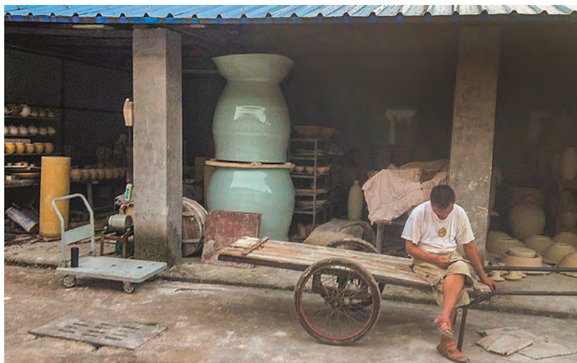
Links: Uli Eigners monumentale Porzellane entstanden 2019 in Zusammenarbeit mit Töpferinnen und Töpfern im chinesischen Jingdezhen. Rechts: Iskender Yedilers Kunstwerk wirkt wie ein aus der Erde sprießendes Fabrikgebäude.

Vom 17. bis zum 27. August bespielt das Festival Begehungen die verlassenenen