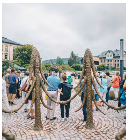
Seit vergangenem Jahr stehen bereits die Kunstwerke unter anderem im Bundsockenpark Thalheim, im Kurpark von Aue-Bad Schlema und am Sauberg in Ehrenfriedersdorf (unten, von links).