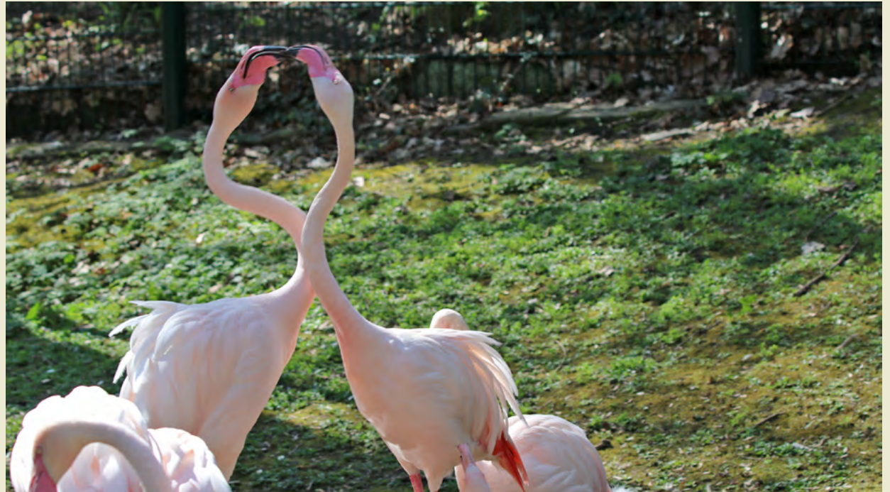
Im Tierpark Chemnitz zwar nicht, aber in freier Wildbahn bilden Flamingos auch homosexuelle Pärchen, die zum Teil auch Jungtiere von anderen Pärchen adoptieren und so deren Überleben sichern.

Flamingos sind aber tatsächlich ein gutes Beispiel dafür, homosexuelles Verhalten nachzuweisen. Bei den Vögeln, die in der Natur in Kolonien von