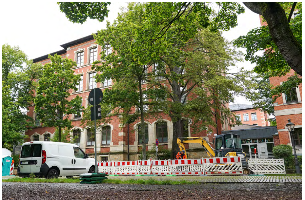
Die Josephinenschule-Oberschule ist eine der ersten Schulen, an der die neue Phase des Breitbandausbaus beginnt.