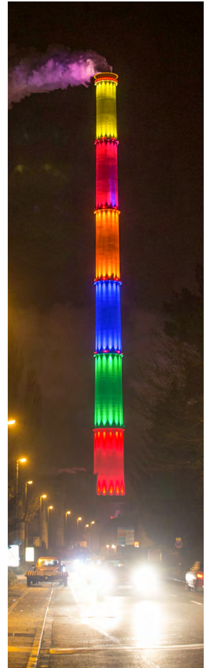
Der Schornstein des Heizkraftwerks Nord befindet sich im Dammweg 10 im Stadtteil Furth und wurde zwischen 1979 und 1984 gebaut. Das linke Foto zeigt diesen Bau um etwa 1980. Vor der Neugestaltung sah der Schornstein gräulich-braun aus, das zweite Foto zeigt ihn um das Jahr 2010. Da er saniert werden musste, entschied sich die eins Energie in Sachsen dazu, ihn nicht nur zu reparieren, sondern ihn auch zu einem Blickfang zu machen. Der französische Künstler Daniel Buren entwarf das Konzept mit den sieben Farben, die nicht nur am Tag leuchten, sondern auch in der Nacht durch LED weithin zu sehen sind.