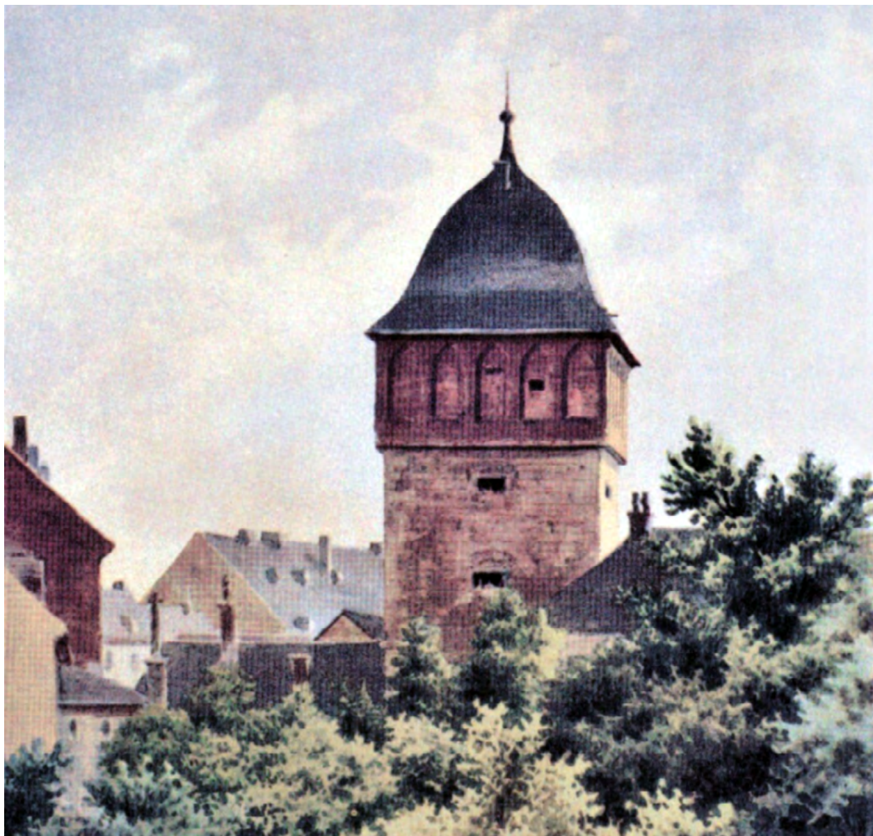
Dicht bewachsen: Blick vom Casino-Park zum Roten Turm um 1890.

Der Rote Turm wurde über viele Jahrhunderte als städtisches Gefängnis benutzt. Diese fortgesetzte Nutzung sicherte dem Bauwerk letztlich seine Existenz, denn anders als die übrigen Türme und Tore der Stadtmauer wurde es im Laufe des 19. Jahrhunderts nicht abgetragen. Mit der angrenzenden Bebauung wurde auch der Rote Turm am 5. März 1945 ein Opfer der Zerstörung. Nach dem Abbruch der Ruinen stand er über viele Jahre einsam auf der abgeräumten Brache. Ein Notdach schützte ab 1950 die Bausubstanz. Unter Leitung des Architekten Georg Laudeley konnte