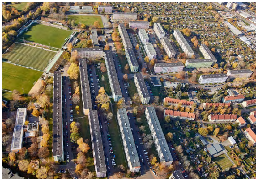
Durch ein umfassendes Quartierskonzept erhält das Wohngebiet in Kappel zum Beispiel mehr Freizeit- und Mobilitätsangebote.

Insgesamt wurde ein großes Maßnahmenbündel aus den Bereichen Stadtumbau, Wohnungswirtschaft, Demografie, soziale Belange, Mobilität, Grün- und Freiflächen, Energieeffizienz und Klimaschutz geschnürt. In einer zweiten Phase wird dieses Quartierskonzept durch ein Energetisches Sanierungsmanagement umgesetzt. In Kooperation mit der Stadt Chemnitz stellt sich die Wohnungsbaugenossenschaft Chemnitz West eG seit