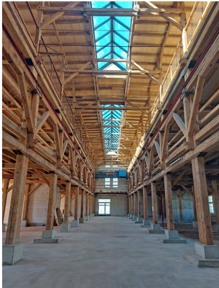
Führungen durch die Historische Holzhalle an der Zwickauer Straße 137 bietet der Verein der Straßenbahnfreunde e. V. von 10 bis 13 Uhr an. Das Gebäude zählt mit seiner original erhaltenen Holzkonstruktion und den massiven Außenwänden zu den frühesten Industriebauten in Sachsen.

Das Straßenbahndepot im Stadtteil Kappel entstand als erster Straßenbahnbetriebshof bereits um 1880 für die Linien der Pferde-Straßenbahn in der Innenstadt. Nach der Elektrifizierung und der Zunahme des Wagenbestandes ab 1893 erfolgte die Erweiterung des Betriebs-