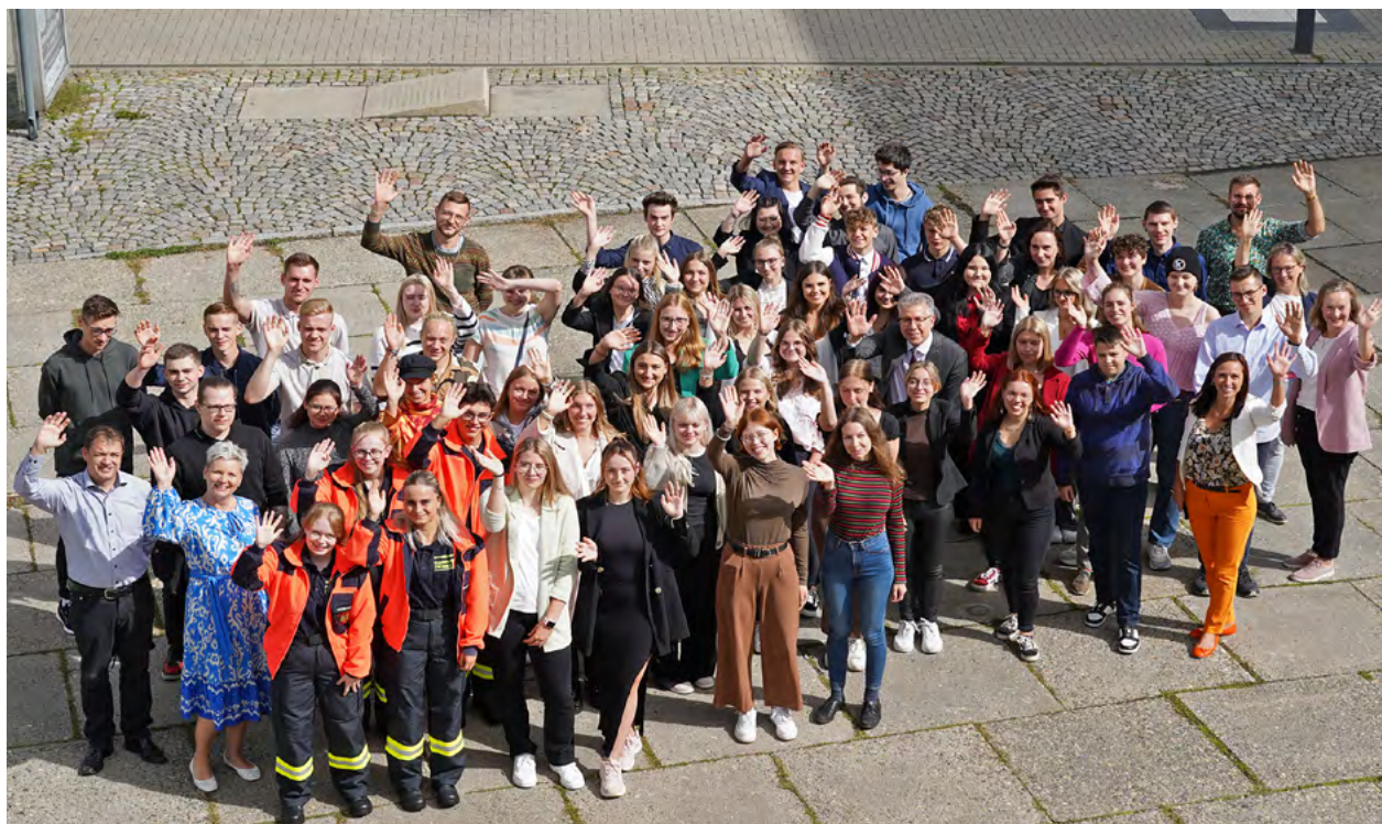
Am vergangenen Freitag begannen 54 Auszubildende und Studierende ihre Ausbildung bei der Stadt Chemnitz. Für zwei Ausbildungsplätze bei der Stadt Chemnitz für 2024 sind noch Bewerbungen möglich.

dung bzw. ein Studium für 2024 finden Informationen unter www.chemnitz.de/Ausbildung .