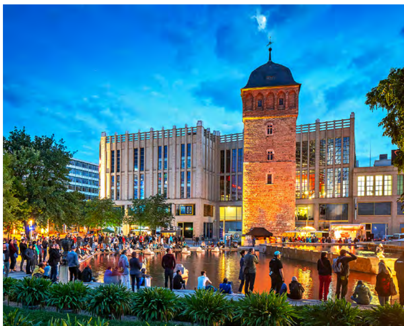
Abendstimmung bei der Fête de la musique im Stadthallenpark.