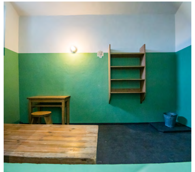
Der Verein Lern- und Gedenkort Kaßberg-Gefängnis e. V. hat drei Schauzellen mit originalen oder nach historischen Vorbildern gefertigten Gegenständen ausgestattet. Er zeigt die Zelleneinrichtung in der Zeit des Nationalsozialismus, in der Untersuchungshaft der Stasi und in der Freikaufhaft. Geöffnet ist der neue Lernort ab dem 28. Oktober immer mittwochs bis sonntags jeweils von 10 bis 17 Uhr.