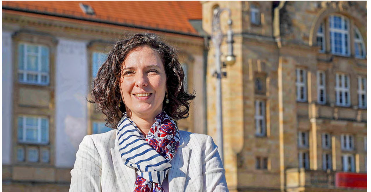
Die neue Generaldirektorin mit klarem Ziel: Fokus auf Einbindung der Menschen und Vernetzung mit der Region.