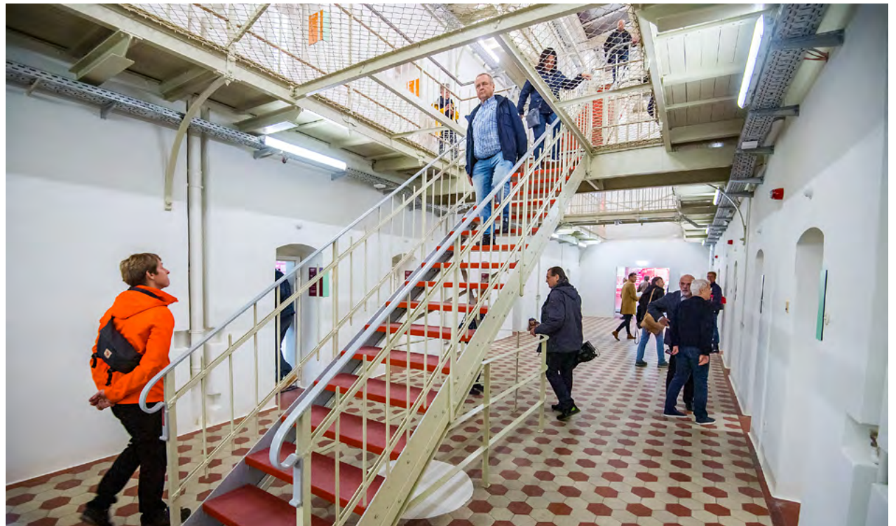
Zur Eröffnung am vergangenen Freitag konnten sich Medienschaffende sowie geladene Gäste bereits den neuen Lern- und Gedenkort anschauen.