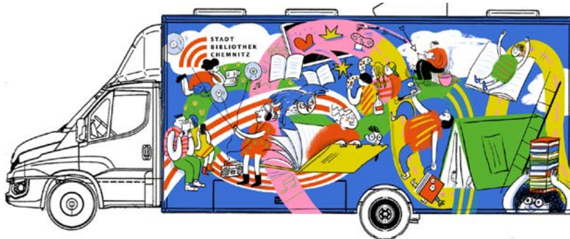
In einer Online-Abstimmung hat sich die Mehrheit der Beteiligten für den Entwurf der Grafikerin Verena Herbst entschieden, die für Chemnitz typische Motive wie den Roten Turm integriert hat.

Zurzeit wird das Fahrzeug bei einem sächsischen Unternehmen montiert und konfiguriert. Die Fahrbibliothek wird unter dem Namen »FaBi« an