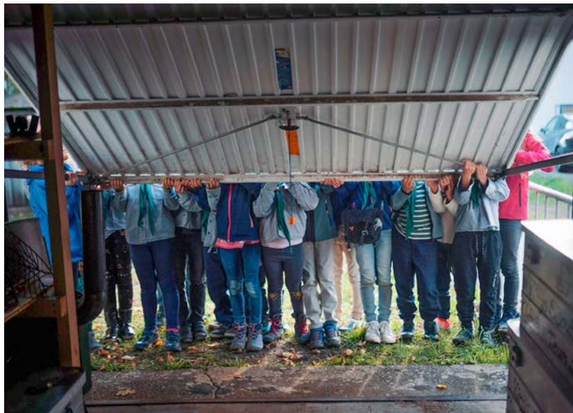
»#3000Garagen« heißt eines der Hauptprojekte für das Programm der Kulturhauptstadt Europas Chemnitz 2025.