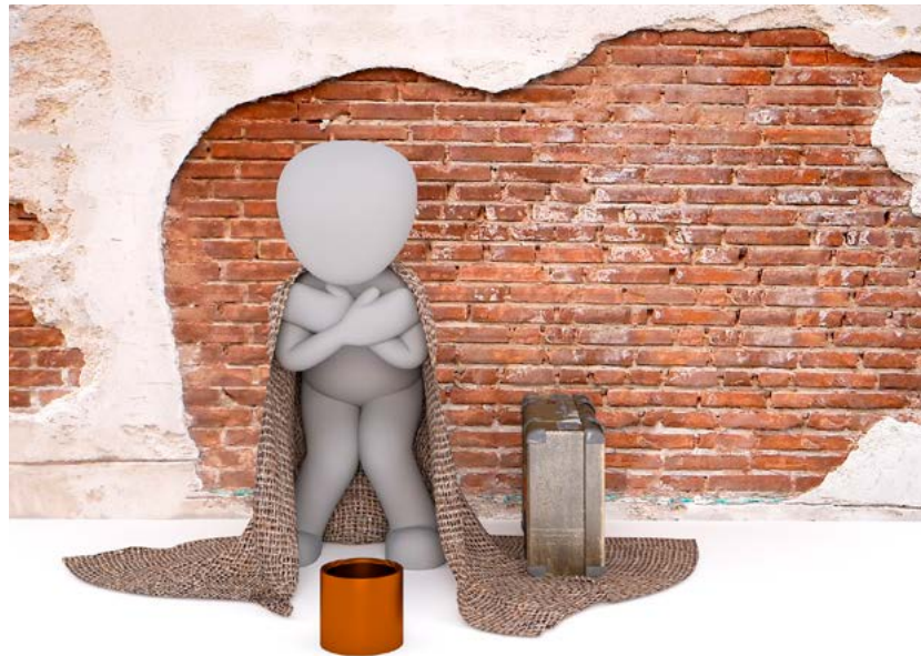
Das Sozialamt der Stadt Chemnitz und viele weitere gemeinnützige Organisationen bieten Wohnungslosen Hilfe und Unterbringung an.

Alle Angebote werden kontinuierlich und bedarfsorientiert vorgehalten. Bei