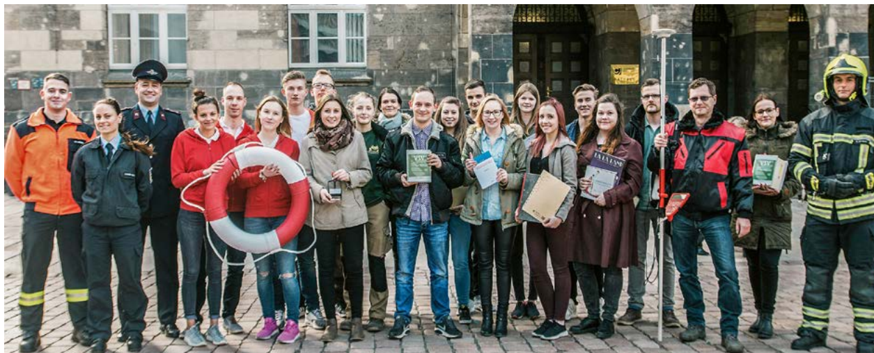
Die Stadt Chemnitz bietet eine Vielzahl von Ausbildungsberufen an.