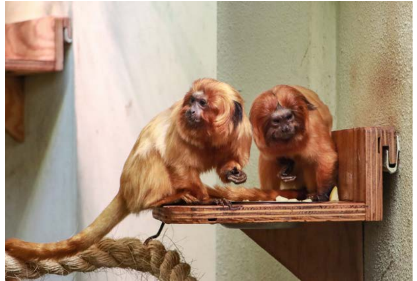
Die Goldgelben Löwenäffchen Stitch und Anja harmonieren gut miteinander. Im Idealfall kann sich der Tierpark Chemnitz über Nachwuchs dieser selten gewordenen Art freuen.

So lernten sich Anja und Stitch erstmal hinter den Kulissen kennen – auf neutralem Grund quasi. Weil Anja schon seit 2018 im Tierpark Chemnitz lebt, sieht sie ihr Gehege als ihr Revier an. Damit sie dort nicht zu dominant auftritt, wurde für die beiden ein anderes Gehege gewählt, wo die nötige Ruhe vorherrscht, um sich kennenzulernen. Mittlerweile teilen sich Anja und Stitch aber das Gehege im Krallenaffenhaus und sind für die Besucherinnen und Besucher zu sehen. Sie harmonieren gut miteinander, verbringen die Nächte oft zusammen in einer Schlafhöhle, gehen tagsüber aber auch mal ihrer Wege. Goldgelbe Löwenäffchen können in Gruppen von mehr als zehn Tieren zusammenleben. Angeführt werden sie von einem Weibchen, welches in der Regel ein erwachsenes Männchen an ihrer Seite duldet. Die anderen Mitglie-