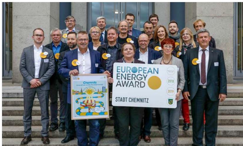
Im Jahr 2019 erhielt Chemnitz für die Nachhaltigkeit der Energie- und Klimaschutzpolitik den European Energy Award in Gold. Am 28. November wird dieses Engagement erneut gewürdigt. Das Amtsblatt berichtet in der nächsten Ausgabe darüber.