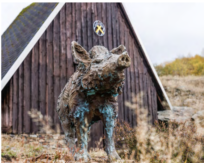
Hinter dem Besucherbergwerk in Ehrenfriedersdorf sind die drei Bronzeskulpturen »Wildschweine« des Bildhauers Carl Emanuel Wolff unter freiem Himmel zu sehen. Seine Tier- und Fabelwesen bevölkern für gewöhnlich weiße Ausstellungsräume.