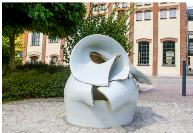
Die monumentalen Porzellankunstwerke »ITEM 3501 / 3502« der Künstlerin Uli Aigner in Löbnitz entstanden im chinesischen Jingdezhen, der Welthauptstadt des Porzellans.