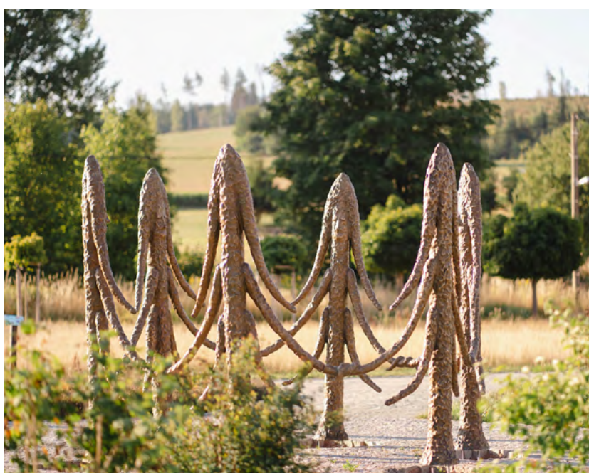
»Include Me Out« (etwa: einschließen Sie mich aus) nennt der Künstler Friedrich Kunath seine nur auf den ersten Blick humorvoll und spielerisch anmutende Skulpturengruppe im Buntsockenpark in Thalheim.