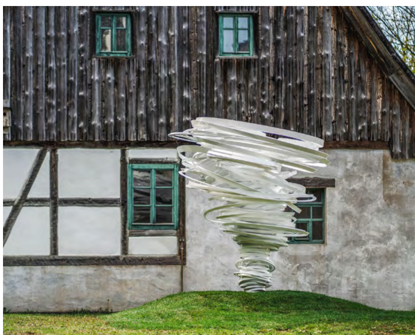
Kybernetik und Entropie sind die wichtigsten Einflüsse der 1946 in Harrisburg/USA geborenen Bildhauerin Alice Aycock. Ihre Skulptur »Twister Again« wirbelt hinter dem Erzgebirgischen Freilichtmuseum in Seiffen.