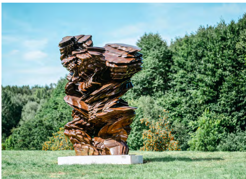
Die patinierte Bronze der Skulptur »Stack« des 1949 in Liverpool geborenen und in Wuppertal lebenden Bildhauers Tony Cragg erinnert im Kurpark in Aue-Bad Schlema an Naturphänomene wie verwitterte Felsen oder vulkanische Rauchsäulen.