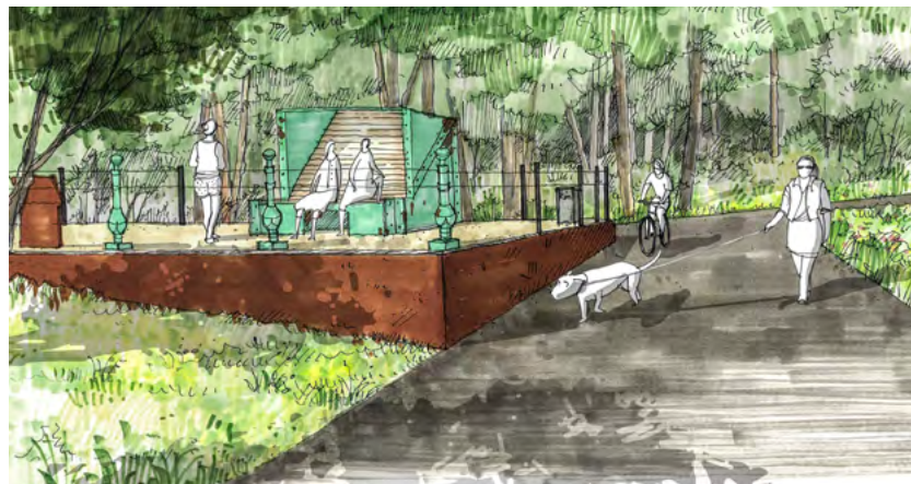
Von der Aussichtsplattform bietet sich ein Blick auf das Viadukt. Für das Geländer werden Pfosten der alten Bücke genutzt. Visualisierungen: Ulrich Krüger Landschaftsarchitekten

Die Umgebung des Bahnviadukts an der Kreuzung Annaberger Straße zur Reichsstraße wird umgestaltet. Nach der Sanierung des Viadukts erweitert die Stadt Chemnitz den Stadtpark. Als Interventionsfläche der Kulturhauptstadt Europas Chemnitz 2025 stehen die Arbeiten unter dem Motto »Stadt am Fluss«.