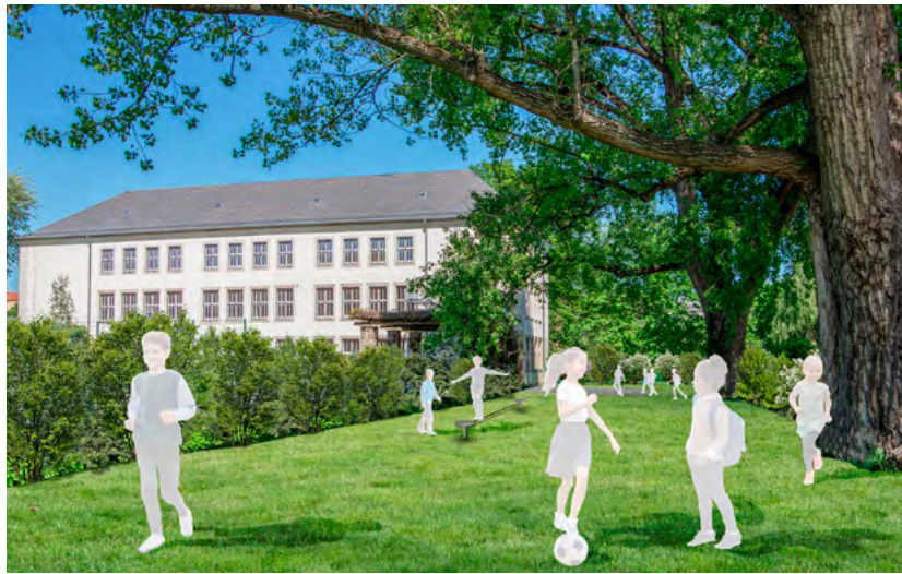
Die Kooperationsschule Chemnitz öffnet für die Schülerinnen und Schüler am Standort Brauhausstraße erstmals die Tore. Foto: Jacob + Bilz Landschaftsarchitekten PartG mbB

Viele Schülerinnen und Schüler begeben sich ab Montag wieder selbständig auf den Weg zur Schule. Damit sie diesen sicher absolvieren können, arbeitet die Stadt Chemnitz mit der Polizeidirektion Chemnitz, den Chemnitzer Verkehrsbetrieben sowie der Verkehrswacht Chemnitz e. V. eng zusammen. Unter www.chemnitz.de/schulweg kann der interaktive Stadtplan für die Planung der Schulwege genutzt wer-