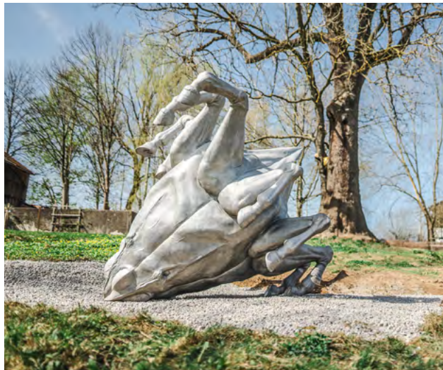
Mit dem »Polygonalen Pferd II« im Oederaner Ortsteil Gahlenz dekonstruiert der in Bremen lebende Künstler Gregor Gaida das Pathos des Reiterdenkmals.