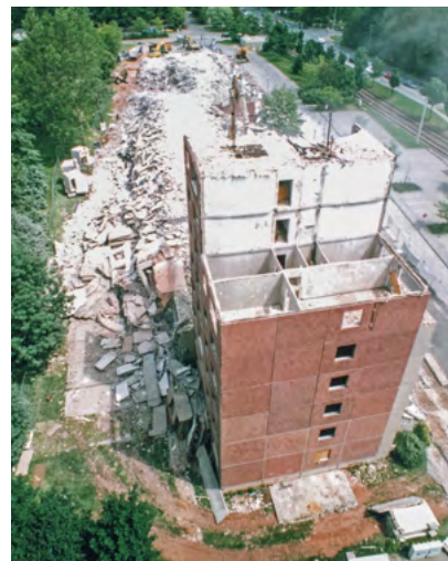
Rückbauarbeiten im Jahr 2006 auf der Dr.-Salvador-Allende-Straße 156-160 (links) und im Jahr 2007 auf der Dr.-Salvador-Allende-Straße 168-178.