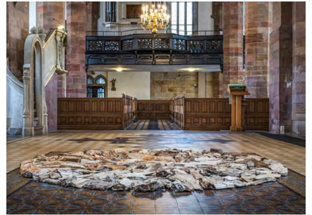
Der »Petrified Wood Circle« von Richard Long pilgert auf dem Skulpturenweg. Voraussichtlich bis Oktober ist er in der Katharinenkirche in Zwickau zu sehen.