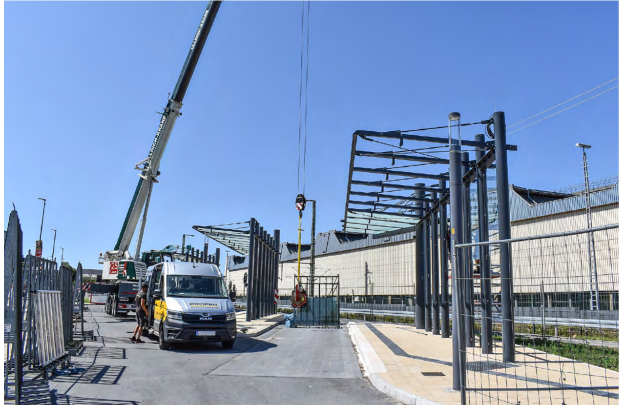
Nach Beendigung der Baumaßnahmen des Fernbusterminals an der Dresdner Straße ist mit der Inbetriebnahme Ende des Jahres zu rechnen. Bis dahin wird das Terminal von Bauzäunen gesichert.

Die Busse werden das Terminal aus landwärtiger Richtung kommend von der Dresdner Straße anfahren. Die Ausfahrt ist nur in stadtwärtige Richtung möglich und erfolgt hinter der Überdachung des Tunnelausgangs zurück auf die Dresdner Straße. Probefahrten, bei denen die Fahrkurven geprüft wurden, sind erfolgreich verlaufen. Fahrgäste werden die teilweise überdachten Bussteige über den verbreiterten