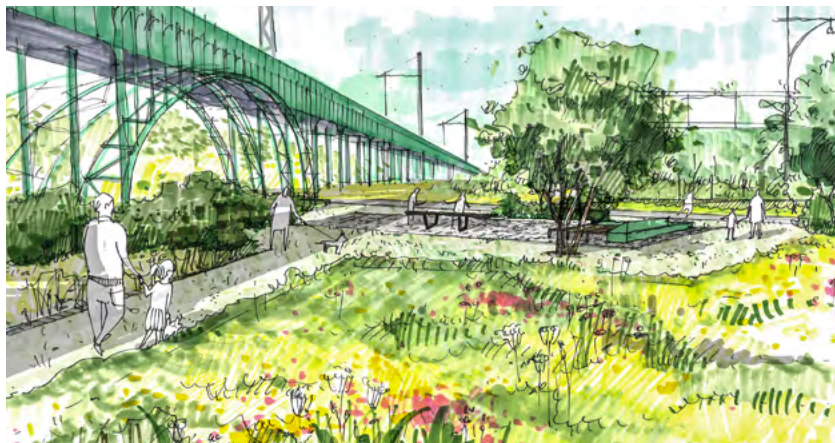
Im östlichen Bereich werden ein neuer Parkweg und ein kleiner Platz mit Sitzskulptur und einer Fläche für ein mögliches Kunstwerk angelegt.