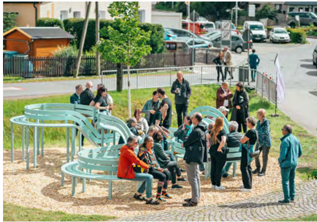
Die »Modified Social Bench for Jahnsdorf #1« hat der Künstler Jeppe Hein speziell für diesen Standort konzipiert. Die Rundungen und Höhenunterschiede ähneln einem Parcours.

Weitere Informationen und eine Vorschau auf Veranstaltungen unter chemnitz2025.de/purplepath