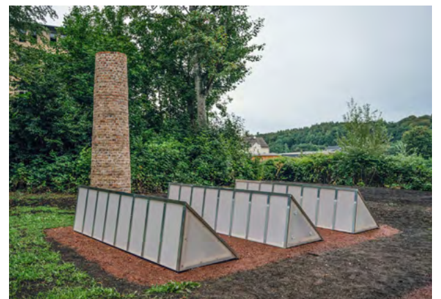
Aus einer Wiese ragen an Sheddächer erinnernde Objekte hervor: »OhneTitel (ESDA)« von Iskender Yediler steht gegenüber des Bahnhofs in Lichtenstein/Sa.