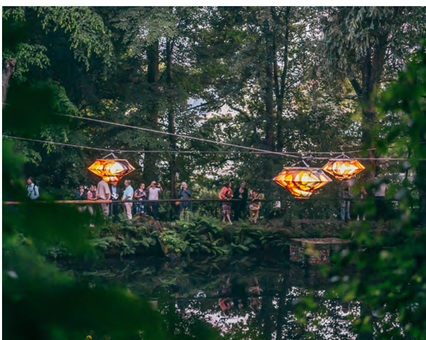
Mit ihrer permanenten Installation »Color Floating« interveniert die in Berlin lebende Bildhauerin und Performancekünstlerin Nevin Aladağ in der Bergbau- und Textilindustriestadt Zwönitz mit Sinnlichkeit, Fantasie und Farbe.