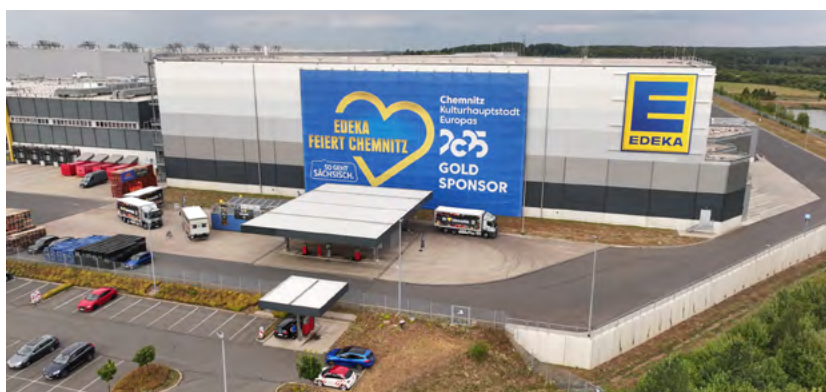
Auf der Autobahn 4 von Chemnitz Richtung Dresden sehen Reisende bei Berbersdorf das Kulturhauptstadtplakat von Edeka.