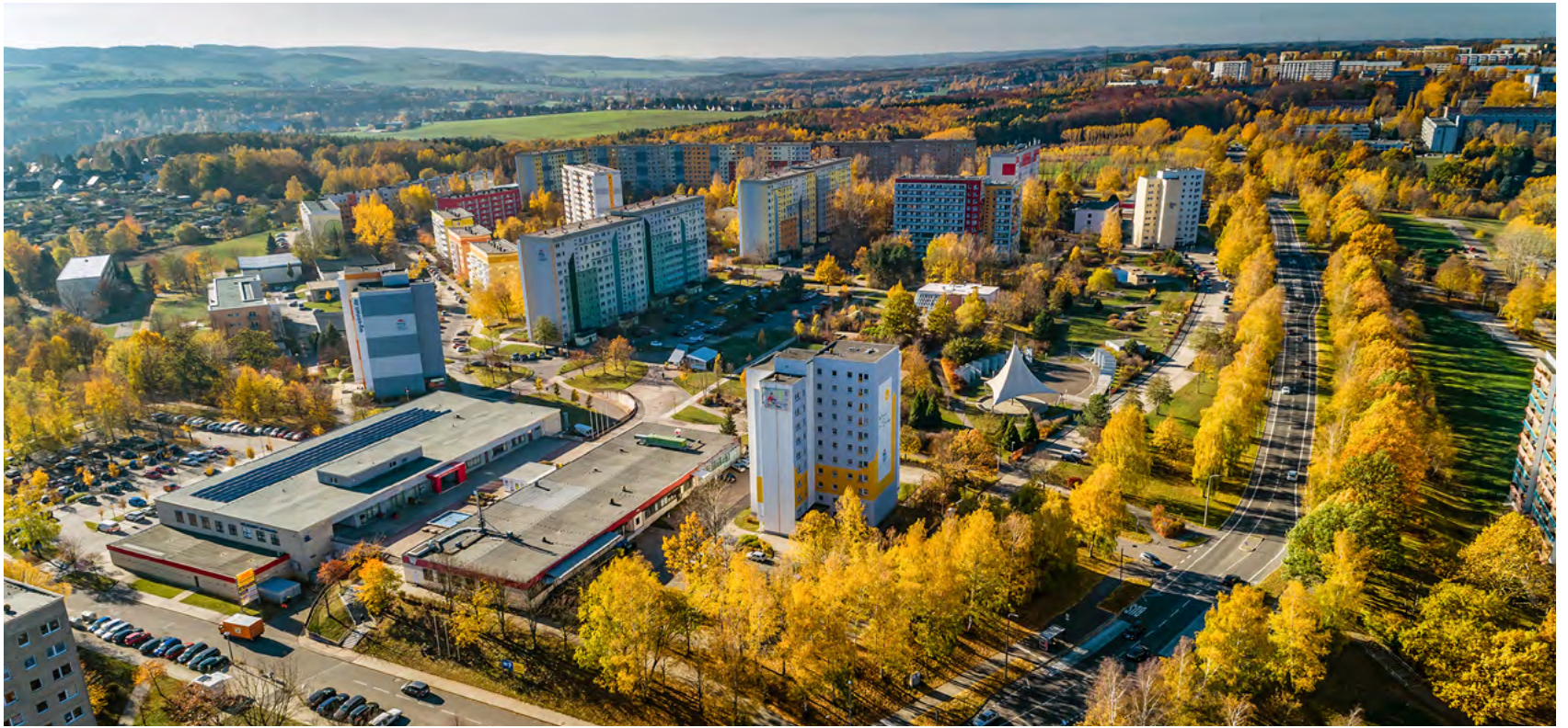
Die Transformation des ehemals größten Neubaugebietes der DDR brachte enorme Aufwertungen mit sich. Im heutigen Markersdorf Süd entstand unter anderem mit der Markersdorfer Oase ein attraktiver Stadtteilpark.

Die Serie »50 Jahre Wohngebiet Fritz Heckert« beleuchtet diese Woche die Transformation des Neubaugebietes. Mit dem gesellschaftlichen Wandel 1989/1990 änderten sich die Existenzbedingungen ostdeutscher Neubaugebiete grundlegend, wenngleich auch nicht schlagartig.