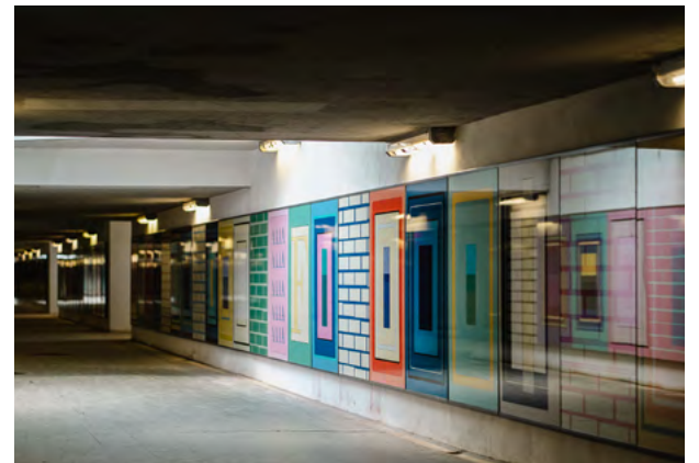
»Glance« (flüchtiger Blick) ist der Titel einer künstlerischen Installation in einem Fußgängertunnel des Bahnhofs Flöha der in Berlin lebenden Künstlerin Tanja Rochelmeyer.