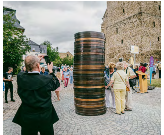
»Coin Stack 2« von Sean Scully in Schneeberg steht für die legendäre Geschichte der erfolgreichen Arbeitskämpfe der Schneeberger Bergleute in den Jahren 1496 und 1498.