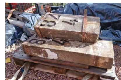
Kilometersteine der Bahnstrecke werden an Weggabelungen platziert. Sie markieren das Wedgedreieck im westlichen Parkteil, in dem sich die Aussichtsplätze und Informationspunkte befinden.

Viadukt zum Symbol von bürgerlichem Engagement. Durch die geplante Umgestaltung soll eine ökologisch wertvolle Fläche entstehen, die eine Verbindung zwischen Natur und urbanem Raum schafft.