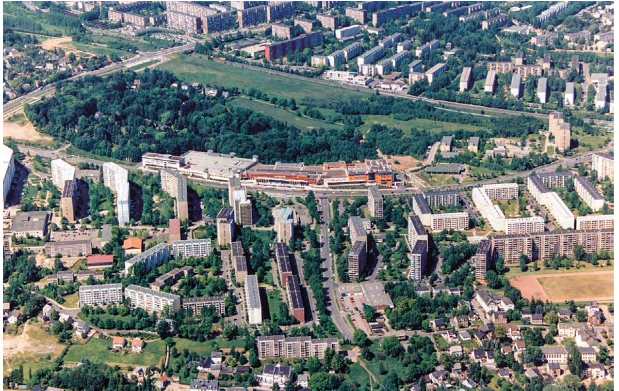
Das Vita-Center, Veranstaltungsort für die Jubiläumsfestlichkeiten, bildet das Herz des Heckert-Gebietes.

Bestimmt existieren zwischen Wenzel-Verner- und Max-Opitz-Straße, zwischen Usti nad Labem und Am Harthwald oder zwischen Robert-Siewert- und Friedrich-Viertel-Straße noch unzählige weitere Geschichten und Geschehnisse, an die erinnert werden will. Dazu ist am 17. und 18. August gute Gelegenheit. So vielfältig das Heckert-Gebiet ist, so ist auch am Feierwochenende für Jede und Jeden etwas Interessantes dabei. Das abwechslungsreiche Programm