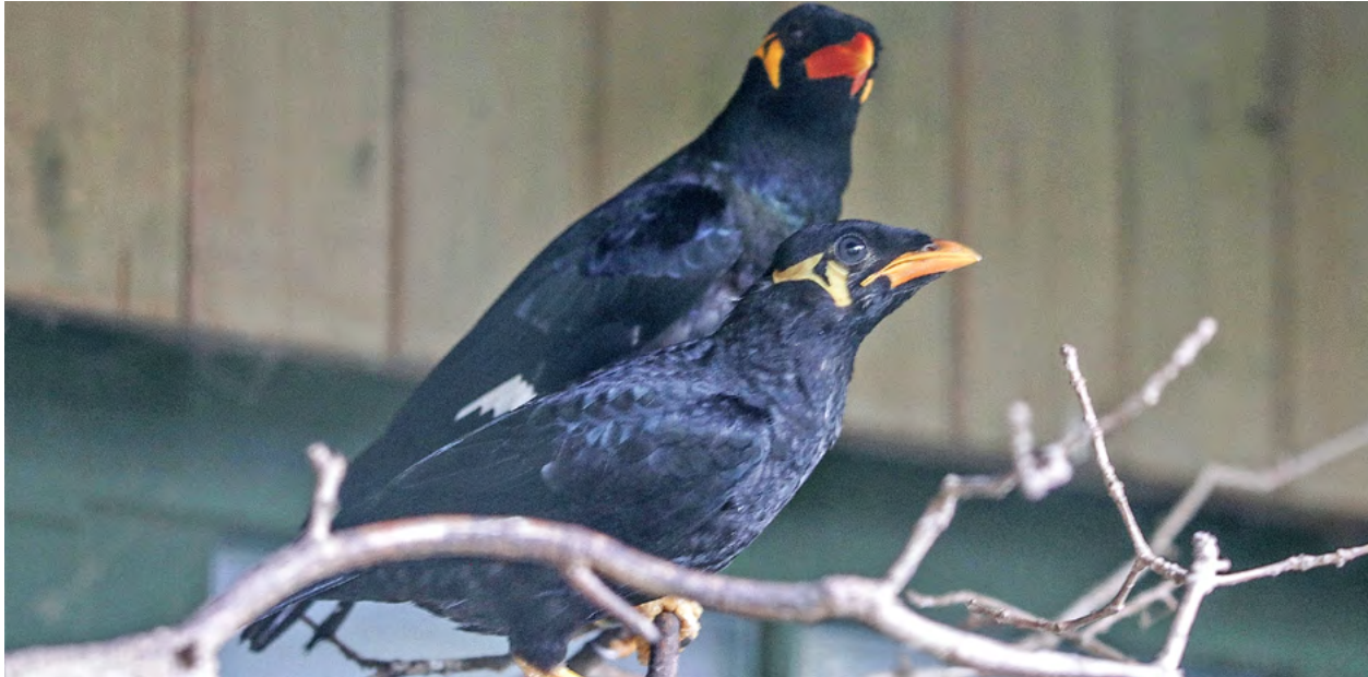
Mittelbeos gehören zu einer Unterart der Stare und sind bekannt dafür, Stimmen und Geräusche zu imitieren.