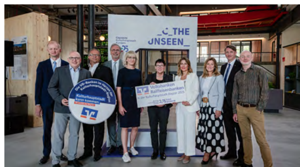
Mit den Volksbanken Raiffeisenbanken (Bild links) und der Nilcs-Simmons-Hegenscheidt-Gruppe (Bild rechts) engagieren sich zwei weitere Unternehmen als Gold-Sponsoren für die Kulturhauptstadt Europas Chemnitz 2025.

Mit den Volksbanken Raiffeisenbanken und der Nilcs-Simmons-Hegenscheidt-Gruppe engagieren sich zwei weitere Unternehmen als Gold-Sponsoren für die Kulturhauptstadt Europas Chemnitz 2025.