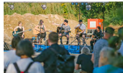
Das #3000Garagen Konzert in Euba fand am 3. August bei bestem Wetter im alten LPG-Garagenhof statt.

Auch in Euba gibt's Garagen- und die hat das #3000Garagen-Team am 3. August gemeinsam mit der Garagengemeinschaft, der Freiwilligen Feuerwehr Euba, dem Heimatverein Euba und den Bands »Duo Lintonix«, »Eickenlob« und »The And The Dead Bitches« gefeiert. #3000Garagen ist eines der Flagship-