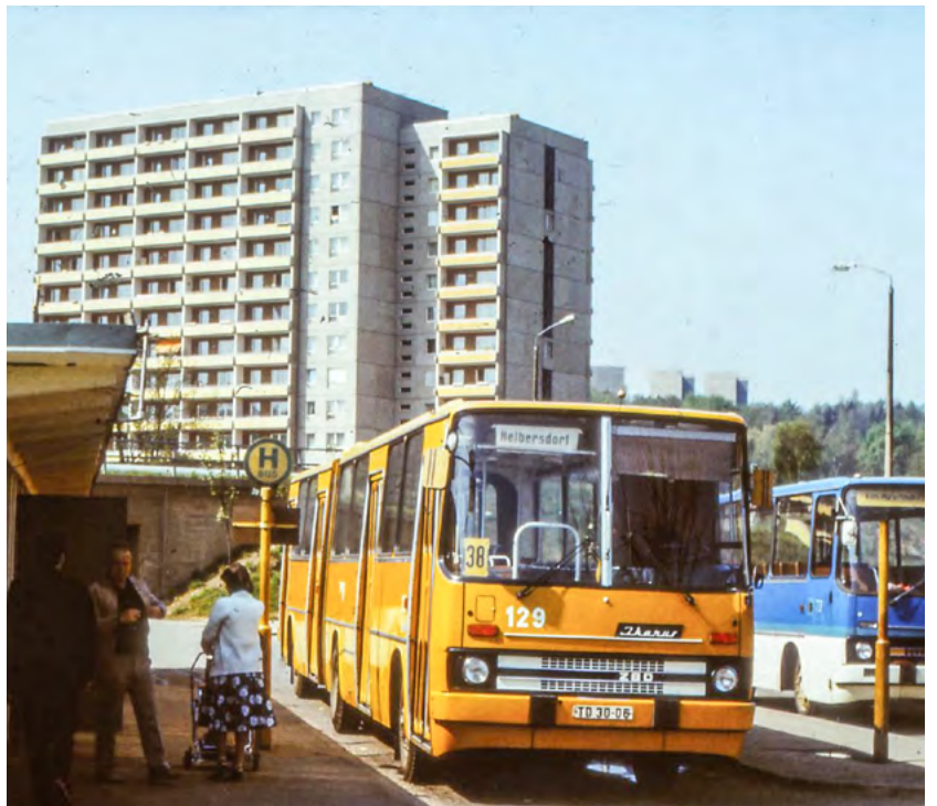
Ein Ikarus-Bus an der Endhaltestelle Helbersdorf im Jahr 1995.