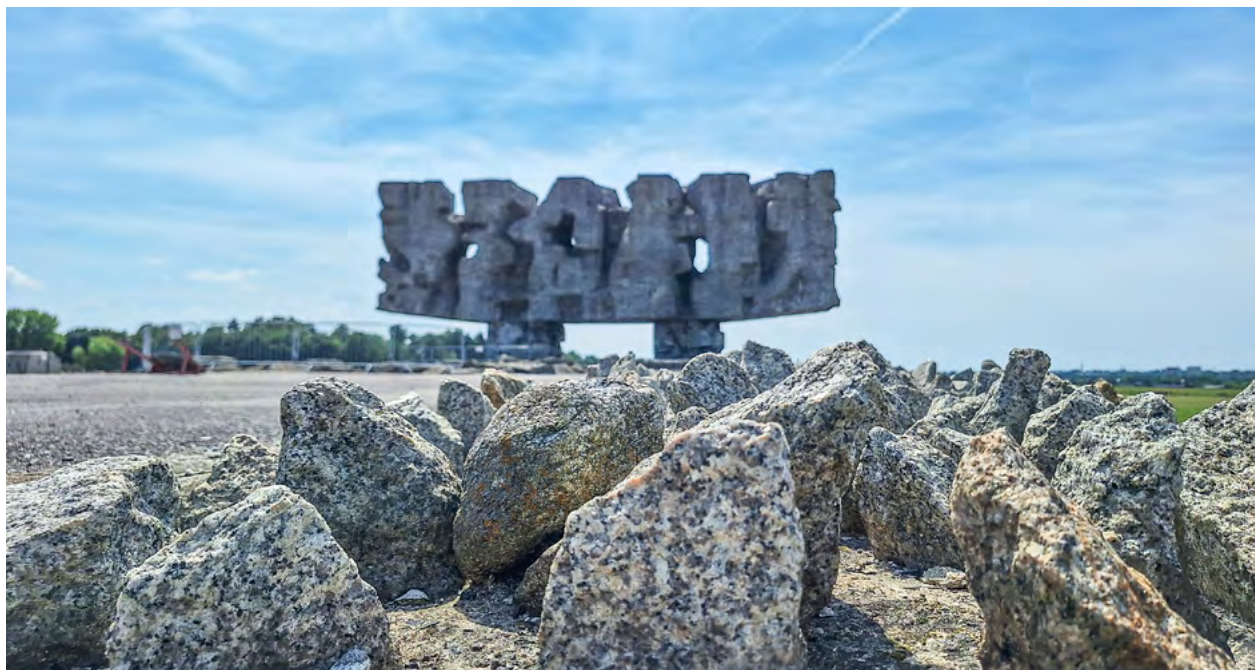
Das mächtigste Denkmal der Gedenkstätte des früheren Konzentrations- und Vernichtungslagers Lublin-Majdanek: Es erinnert an eines der ehemaligen Lagertore, das für die Menschen das Tor zur Hölle war.

Für viele in Deutschland Lebende ist der russische Angriffskrieg in der Ukraine zu einem unliebsamen und gern verdrängten Thema geworden. Das erkennt man schon daran, dass die Zustimmung für Waffenlieferungen in den letzten Monaten immer mehr abgenommen hat. Hier ist das anders. Auch wenn wir vom Krieg selbst nichts mitbekommen, ist er allein schon durch die hier lebenden Ukrainerinnen allgegenwärtig. Nun habe ich selbst keine persönliche Verbindung zu diesen Ländern, kenne niemanden, der direkte Kriegserfahrungen machen musste, und habe auch nicht im geringsten eine Vorstellung, wie groß das Leid der Betroffenen sein muss. Trotzdem sind die Kriege durch meine Bekannten hier im Alltag immer, wenn auch unerschwellig, präsent und es kommt vor, dass mich das Ganze runterzieht. In den vergangenen Monaten habe ich mit 22 deutschen Gruppen gearbeitet. Den Großteil bildeten Schulklassen bzw. Leistungskurse, aber auch Studierende und einige Erwachsenengruppen waren