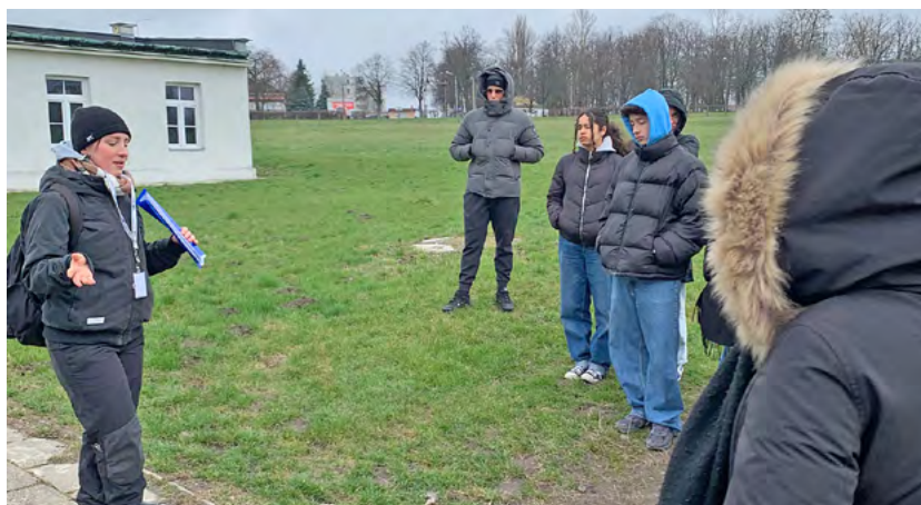
Eine ihrer Hauptaufgaben ist es, junge Menschen durch die Gedenkstätte zu führen.