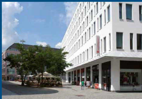
Bürgerhaus Am Wall Düsseldorfer Platz 1, 09111 Chemnitz

Stadt Chemnitz - Sozialamt (Город Хемниц – управление социального обеспечения) Moritzhof, Bahnhofstraße 53 09111 Chemnitz Тел.: 0371 488-5001 Факс: 0371 488-5099 E-mail: sozialamt@stadt-chemnitz.de www.chemnitz.de