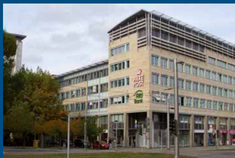
Neubau an der Alten Post Bahnhofstraße 54 а, 09111 Chemnitz