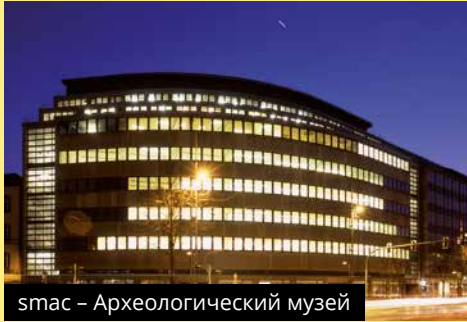
smas – Археологический музей