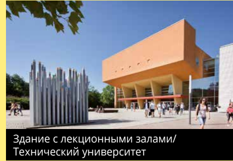
Здание с лекционными залами/ Технический университет