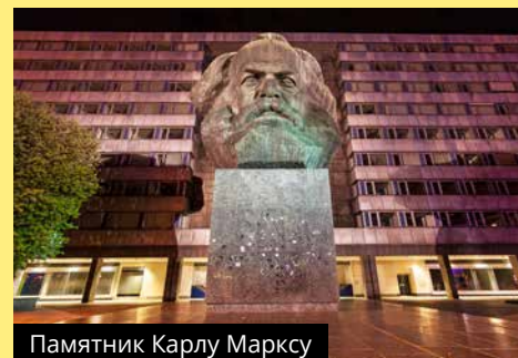
Памятник Карлу Марксу