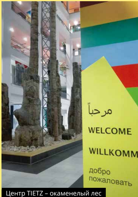
Центр TIETZ – окаменелый лес