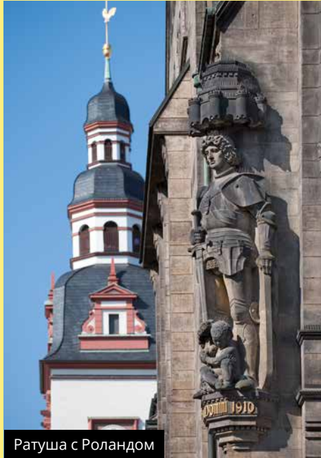
Ратуша с Роландом