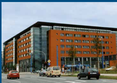
Moritzhof Bahnhofstraße 53, 09111 Chemnitz